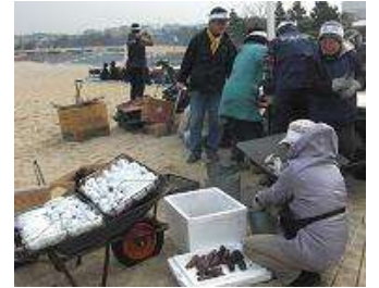
焼きもち(うみへの森を育てる会)