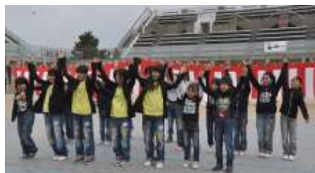
ヒップホップダンス (阪南AC)