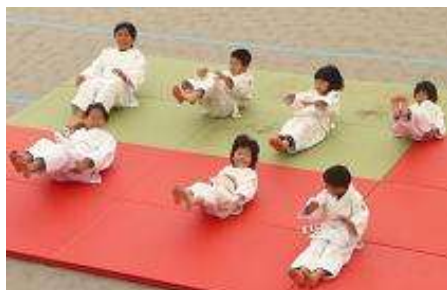
柔道 (岬スポーツ少年団)