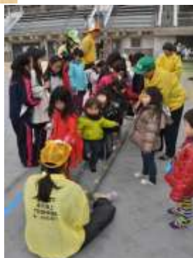
バンブーダンス (友遊パトロール)