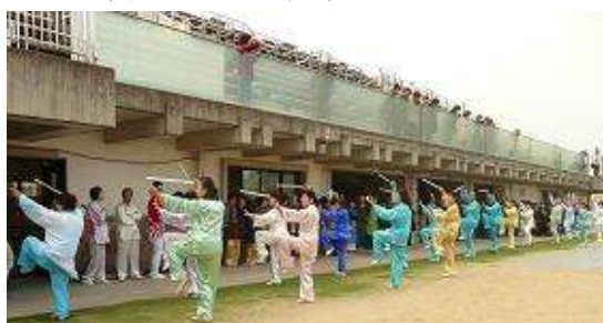
太極拳 (いずみ楽楽太極拳グループ)