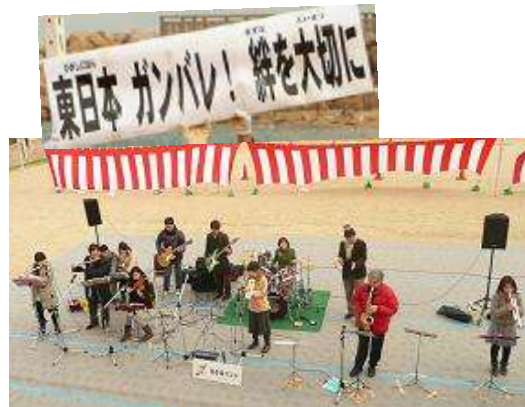
バンド演奏 (花ふるバンド)