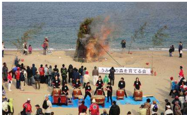
とんど (うみべの森を育てる会)・太鼓 (阪南太鼓楽鼓)