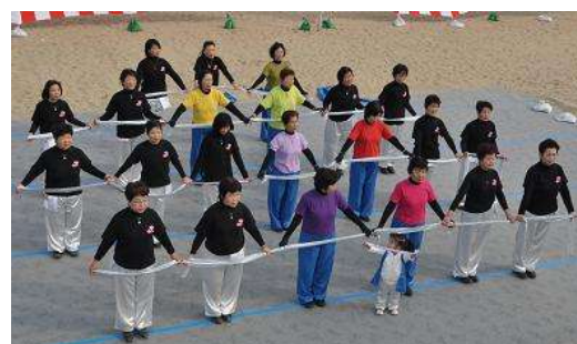
健康体操 (みさきタコクラブ)