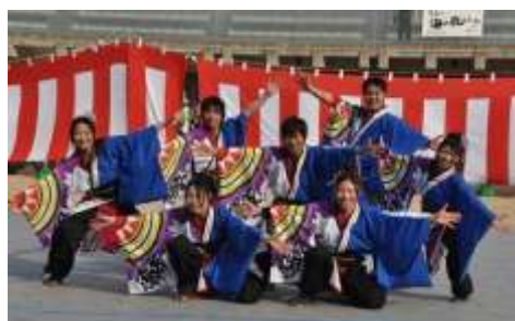
よさこい踊り (大阪観光大学チーム明~saya~)