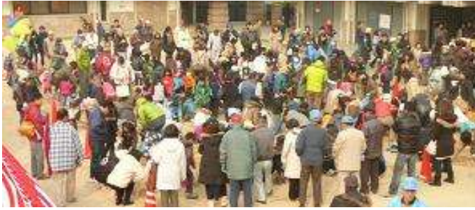
ビーチ de 宝さがし