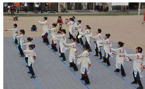
よさこいソーラン (阪南ソーリャ “波有手”)