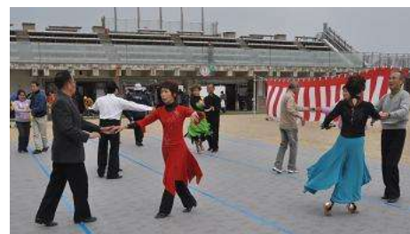
社交ダンス (スポーツダンス)