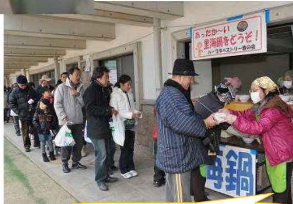
先着 500 名 整理券と交換ですよ！