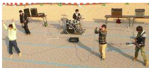
バンド演奏 (岬高校軽音楽部)