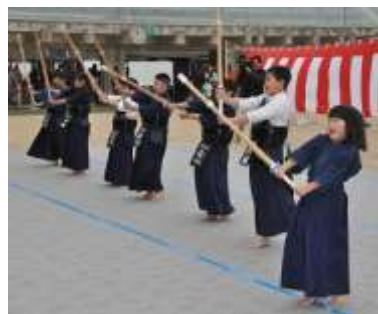
剣道 (岬スポーツ少年団)