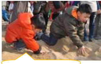
ボールどこかなあ？