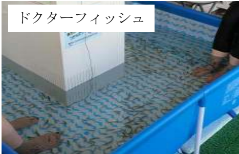
ドクターフィッシュ

7/1～海水浴がオープンしました！暑い夏はやっぱり海で泳がなくなっちゃ！トリピーターのファミリーや若者、子供会などで賑わっております。海を見ながらバーベキューもできて一日ゆっくり遊べます♪またビーチバレー大会やキャンドル物語などいろいろなイベントが開催されます。