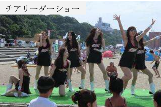
チアリーダーショー