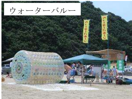
ウォーターバルーン

7/1～海水浴がオープンしました！暑い夏はやっぱり海で泳がなくなっちゃ！トリピーターのファミリーや若者、子供会などで賑わっております。海を見ながらバーベキューもできて一日ゆっくり遊べます♪またビーチバレー大会やキャンドル物語などいろいろなイベントが開催されます。